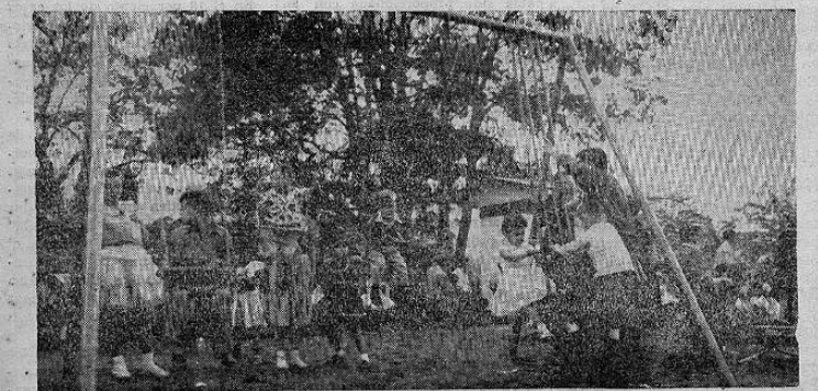
Fue un día feliz para los hijos de los empleados de la Compañía Nacional de Fuerza y Luz. Hélos aquí, gozando de los "play-grounds", después de haber sido obsequiados con helados, refrescos, confitures, bolas, golosinas y otros juguetes.

Y era realmente impresionante ver cómo los trabajadores todos, al concluir la fiesta, abrazaban hondamente emocionados, al Gerente de la Compañía, señor Sanborn.